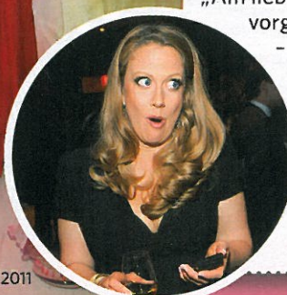
Mit Humor für Prävention: Barbara Schöneberger