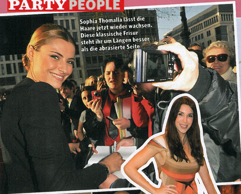
Sophia Thomalla lässt die Haare jetzt wieder wachsen. Diese klassische Frisur steht ihr um Längen besser als die abradierte Seite